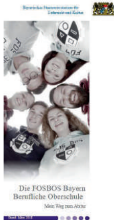
Abb. 8 Broschüre: Die FOSBOS Bayern

Quelle VIII: Bayerisches Staatsministerium für Unterricht und Kultus