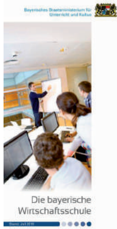
Abb. 6 Broschüre: Die bayerische Wirtschaftsschule

Quelle VI: Bayerisches Staatsministerium für Unterricht und Kultus