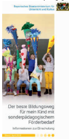
Abb. 7 Broschüre: Der beste Bildungsweg für mein Kind mit sonderpädagogischem Förderbedarf

„Auch ich war Schüler am Förderzentrum, mit viel Fleiß und Durchhaltevermögen habe ich es geschafft, meinen Schulabschluss zu machen. Anschließend begann ich eine Ausbildung zum Fahrzeugtechniker, die ich erfolgreich absolvierte. Zuerst kam der Gesellenbrief, der mich dann nochmals motiviert hat. Seit dem 11. September 2019 halte ich jetzt stolz meinen Meisterbrief im Kraftfahrzeugtechniker-handwerk in der Hand.“