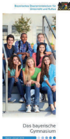
Abb. 5 Broschüre: Das bayerische Gymnasium