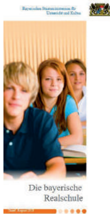
Abb. 4 Broschüre: Die bayerische Realschule

Quelle IV: Bayerisches Staatsministerium für Unterricht und Kultus