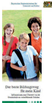
Abb. 2 Broschüre: Der beste Bildungsweg für mein Kind

Quelle II: Bayerisches Staatsministerium für Unterricht und Kultus